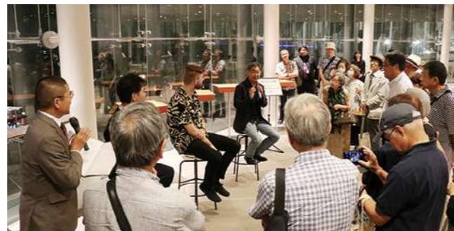
※アフタートークの様子