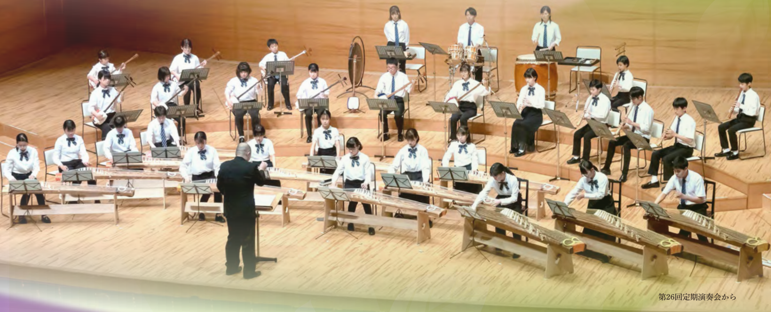
第26回定期演奏会から