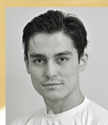
ダレル・ザバロフ