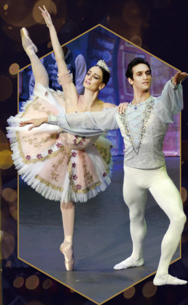
全2幕 作曲:P.チャイコフスキー 振付/演出:A.ファジュエーチェフ、N.アナニアシヴィリ

伝説のプリマ、 ニーナ・アナニアシヴィリが 20年の時をかけた育んだバレエ団。 充実期を迎えた今 ついに12年ぶりの再来日！